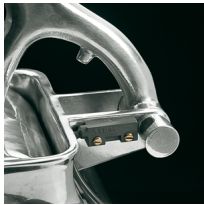
Microswitch on the grater