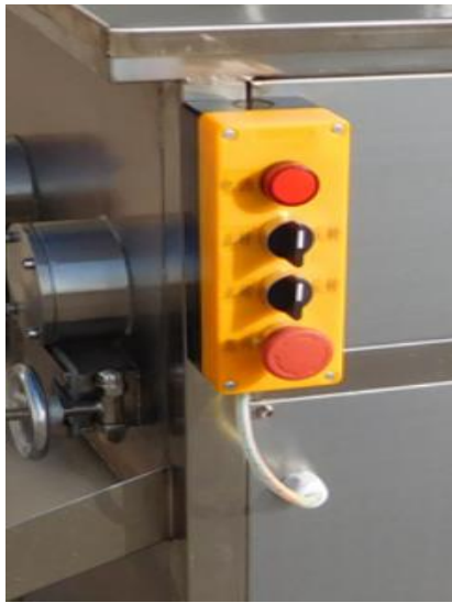
Панель управления модели без вакуума